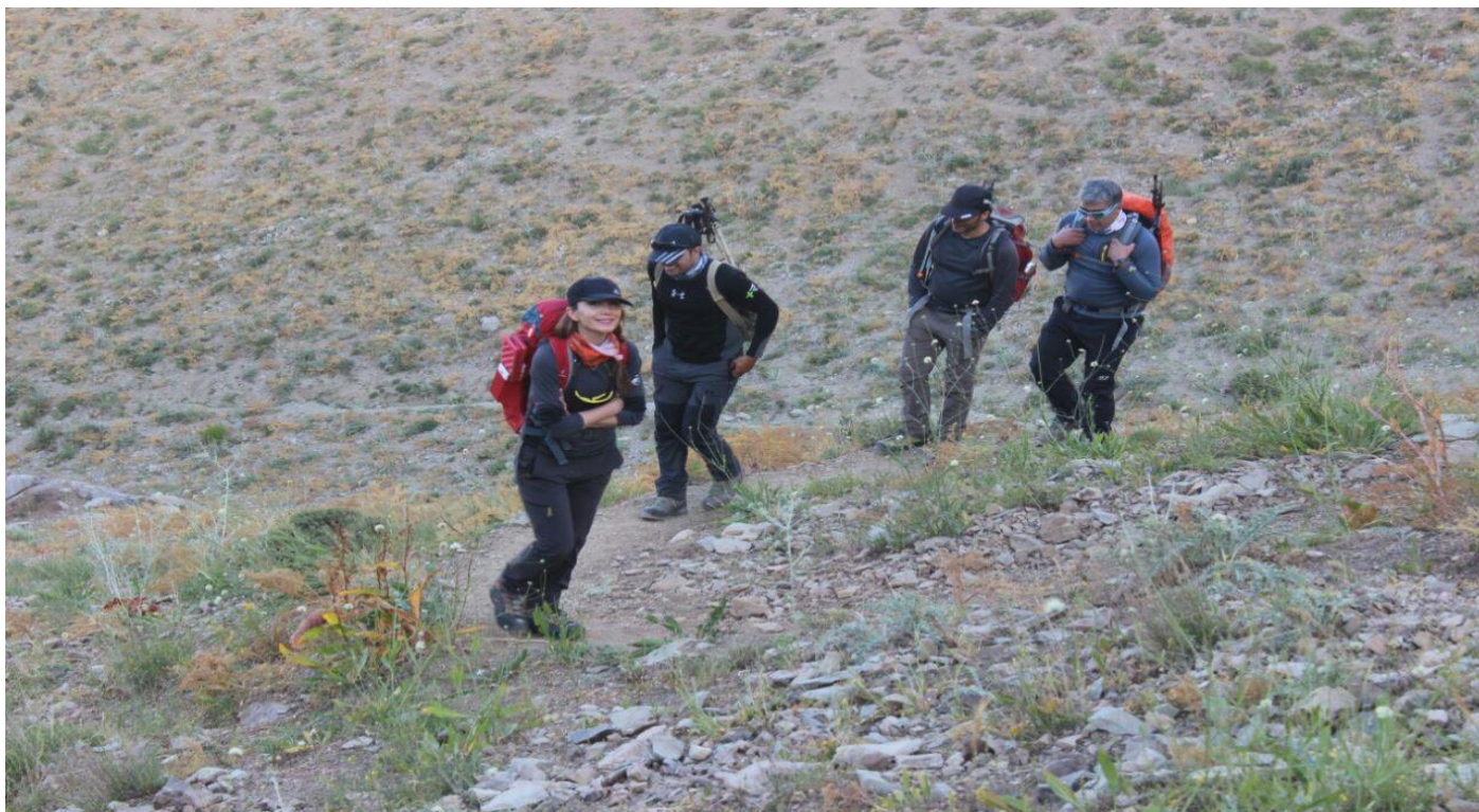
اسامی شرکت کنندگان در برنامه :