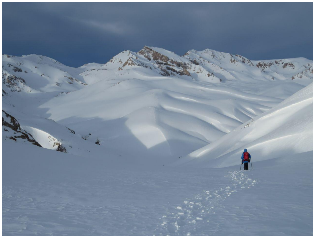
در مسیر دشت سیاهرود