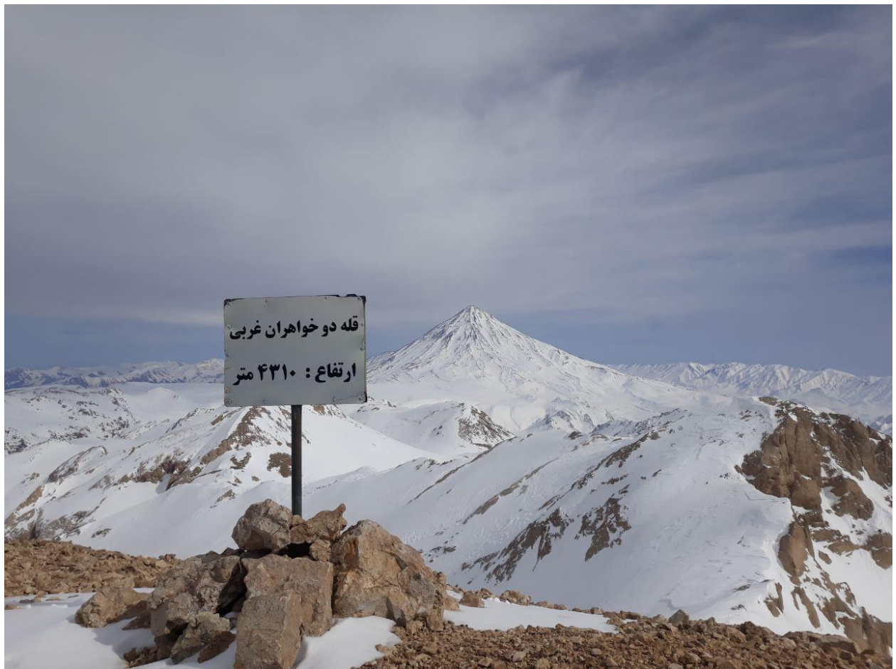
البرز سفید پوش