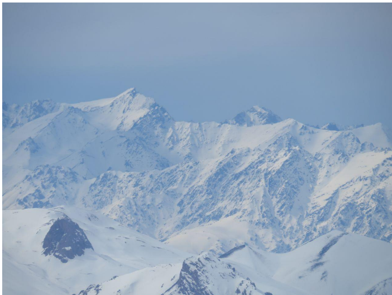
منطقه تخت سلیمان