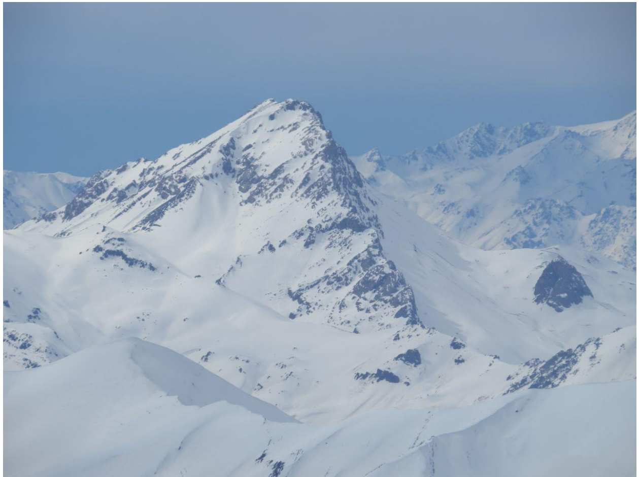
رخ شرقی آزادکوه