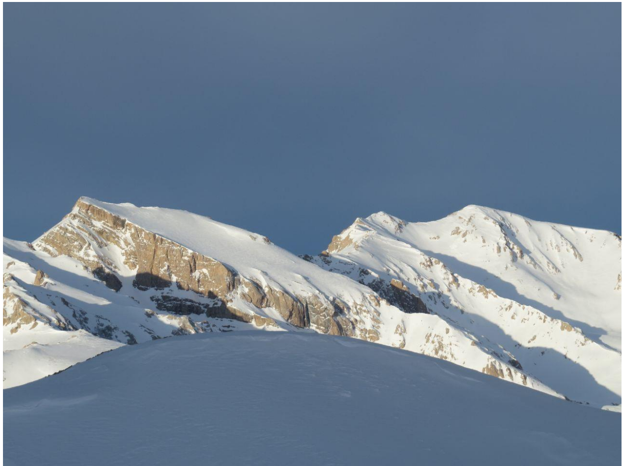
مخروط‌سرو و دوخواهران‌ها