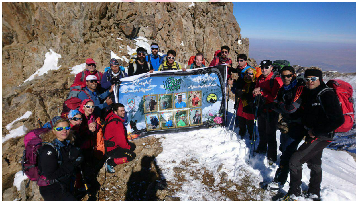
قله کلاغ لان